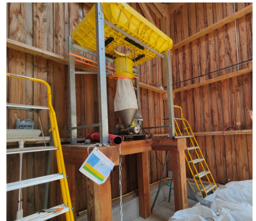
La presse à huiles