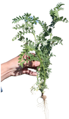
Un jeune plant de pois chiche

Au cours de cette visite, les participants ont découvert les différentes variétés végétales cultivées à la ferme, des légumineuses aux oléagineuses . Pascale CROC a expliqué en détail les méthodes de production et de transformation , les enjeux de l'agriculture biologique ainsi que ses avantages et ses inconvénients. Les agents et les élus ont également pu comprendre les défis auxquels sont confrontés les agriculteurs , tout en saisissant le sens profond de leur travail .