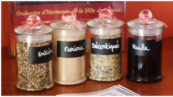
Du chanvre sous différentes formes