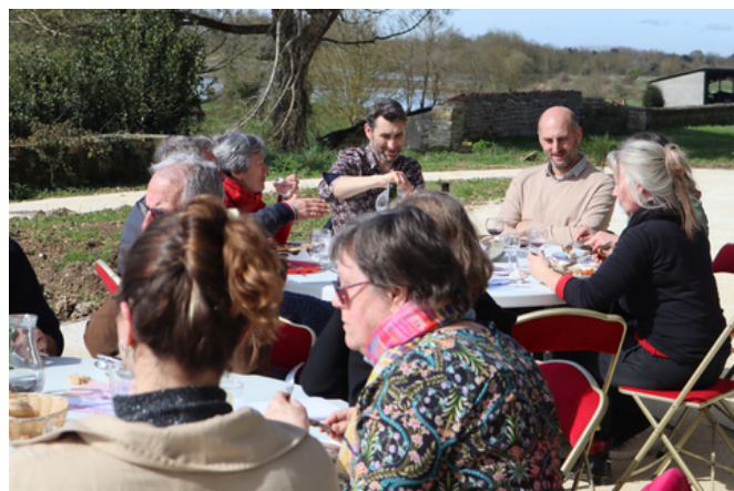
Les participants en pleine dégustation.