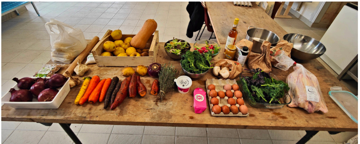
Ensemble des produits utilisés dans le cadre du défi locavore bas carbone

Le repas locavore bas carbone a été un bon outil pour évoquer le sujet de la transition alimentaire (aujourd'hui nécessaire) du territoire afin d'offrir une alimentation saine , de qualité et accessible à tous , de rémunérer justement les agriculteurs et de préserver la biodiversité .